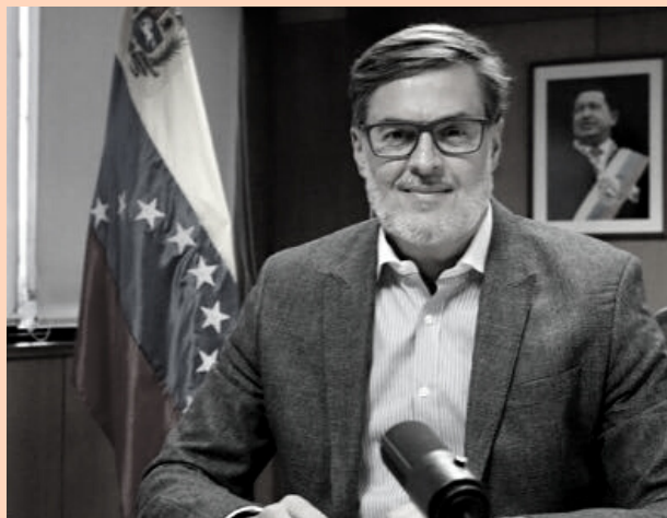
Embajador en China, Félix Plasencia

Total hermetismo mantiene el equipo económico del presidente Nicolás Maduro sobre el anuncio hecho por el gobierno de China de establecer un impuesto a varios tipos de petróleo como el LCO (light cycle oil), aromáticos mixtos y bitúmenes diluidos, entre los que entraría las mezclas y mejorados de la faja del Orinoco.