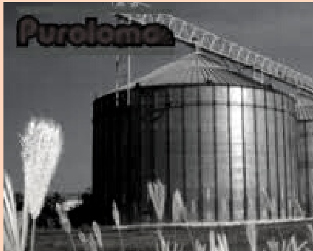
Puroloño emitió papeles comerciales

El mercado de valores ha sido testigo de 42 emisiones en papeles comerciales en lo que va de año. De este total, nueve son empresas que emitieron por primera vez. La cifra habla por sí sola sobre la manera de cómo el sector privado ha hallado la forma de levantar financiamiento en condiciones favorecedoras en medio de un ambiente de hiperinflación.