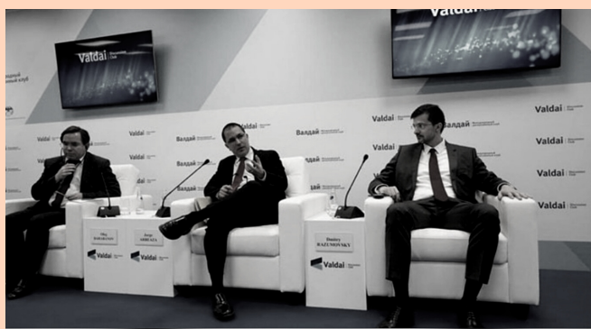
El canciller Jorge Arreaza en el Club de Valdai

El canciller de Nicolás Maduro, Jorge Arreaza, está en Rusia como invitado al Club de Valdai, un encuentro organizado por la élite rusa que desde 2004 reúne a los empresarios más poderosos y a la que siempre ha asistido Vladimir Putin y todo el alto gobierno del Kremlin.