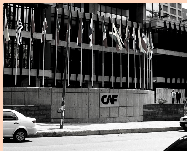
Sede de la CAF en Caracas