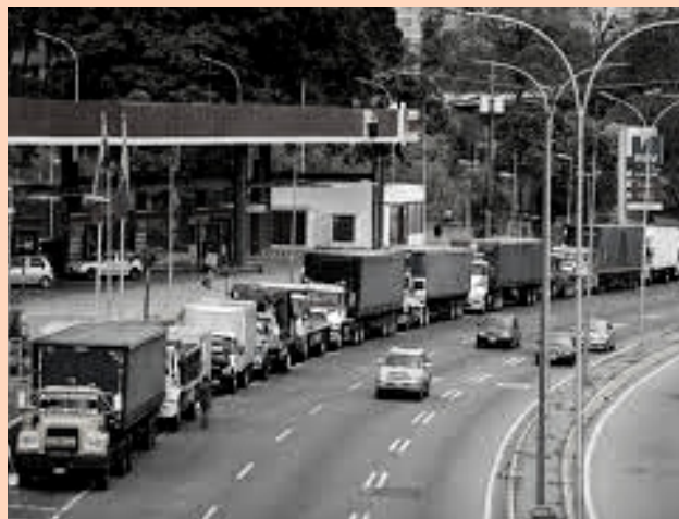
Largas colas en Venezuela por falta de diésel