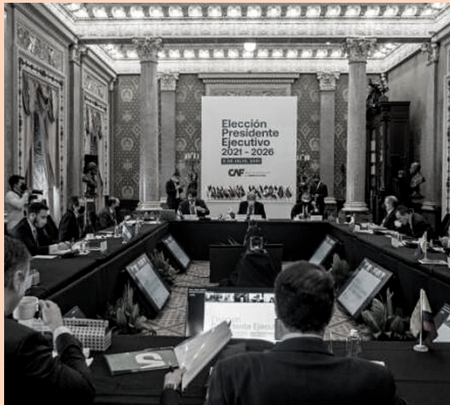
Asamblea de la CAF, Julio 2021