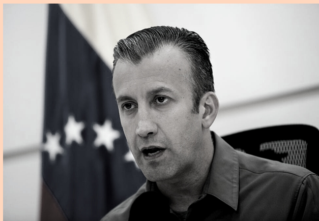
Ministro de Petróleo Tareck El Aissami

La 19ª reunión del mecanismo de la OPEP+ -que reúne a miembros de la Organización de Países Exportadores de Petróleo y otras 10 naciones lideradas por Rusia- concluyó sin acuerdo por las discrepancias sobre el volumen y el tiempo que debe asumirse para elevar la oferta de crudo mundialmente.