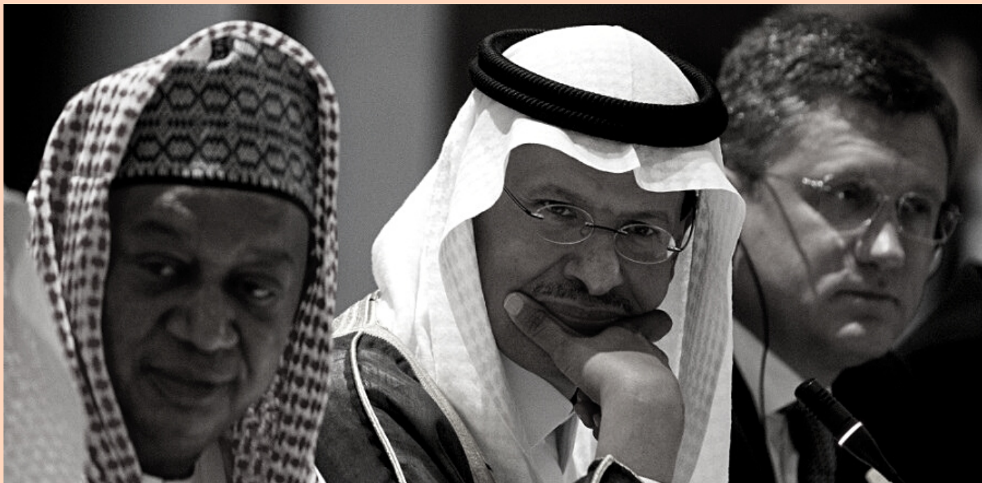
De izquierda a derecha: el secretario general de la OPEP, Mohammed Barkindo; el ministro de Energía saudita, el príncipe Abdulaziz bin Salman y el ministro de Energía ruso, Alexander Novak.

Un producto de Carpe Diem Comunicaciones C.A. en alianza con HispanoPost