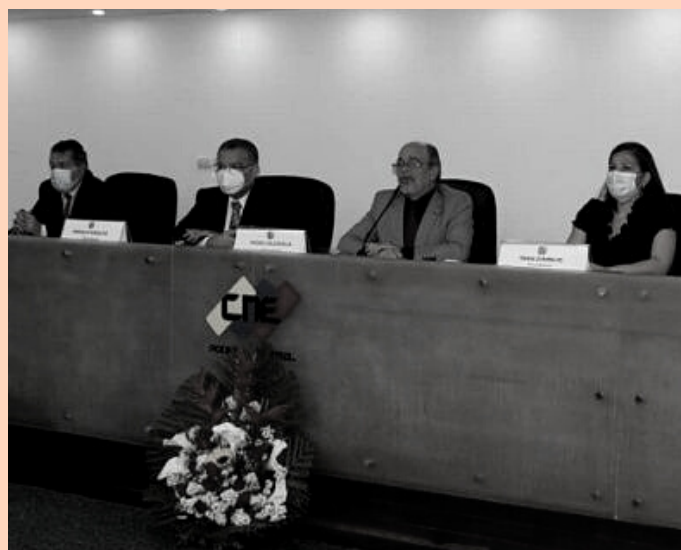
Parte del directorio del CNE

Aunque todavía su aprobación no se ha colocado en la agenda del Consejo Nacional Electoral, fuentes del ente comicial informaron a Exclusivas Económicas que ya fue redactado un nuevo reglamento de observación internacional, el cual tendría la aprobación del presidente de la Asamblea Nacional, Jorge Rodríguez, y la rectora Tania D'Amelio.