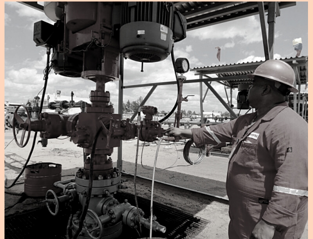
Se están recibiendo $20 adicionales por barril

El nivel de exportación petrolera de Venezuela durante ocho meses de 2021 prácticamente es similar al del mismo período de 2020: un promedio de 652.400 barriles por día versus 669.500 barriles, respectivamente. Es decir, apenas una diferencia de algo más de 17.000 barriles que quizás logre igualarse o superarse en los cuatro últimos meses.