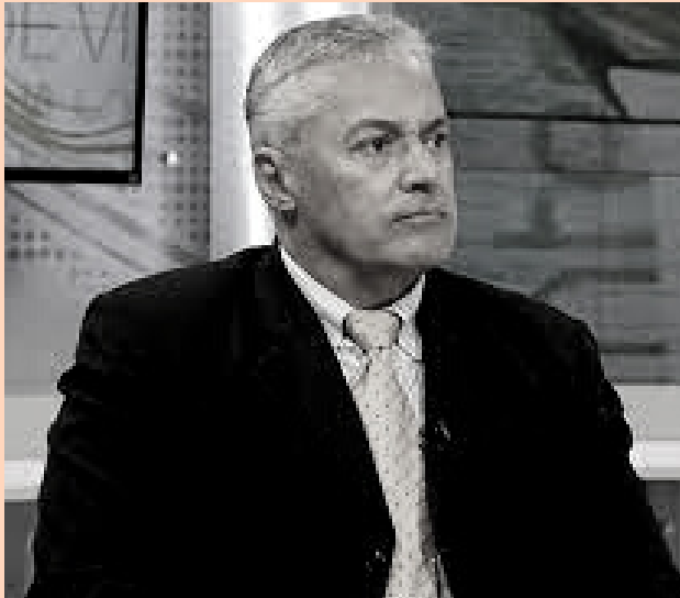
Alí Padrón, Ministro de Turismo

En una reunión realizada el día lunes 13 de septiembre, el ministro de Turismo, Alí Padrón, señaló: "Yo estoy convencido que si nosotros hacemos las cosas bien, el mercado de valores no solamente va a tener un desarrollo importante desde la vía del sector turismo, sino que vamos a apoyar para ir avanzando dentro de la gran dificultad y desafío que tenemos por delante".